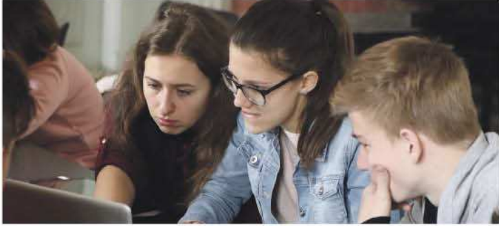
BG Rein- und Gast Schüler erarbeiteten einen interaktiven Museumsführer über die Stadt Graz.